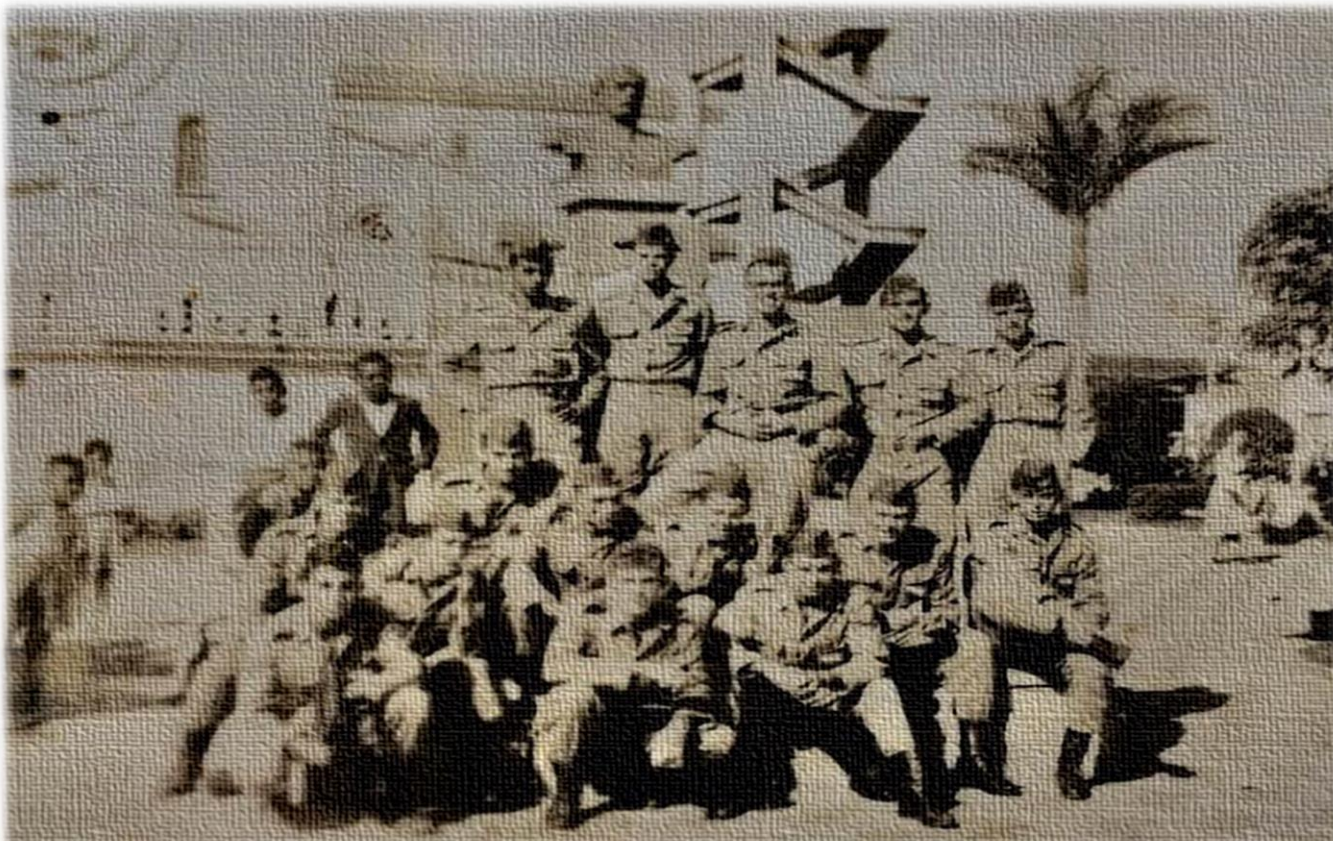
Atiradores da Turma de 1958 do então Tiro de Guerra 293 (atual TG 02-076) defronte à Herma do Duque de Caxias na Praça Duque de Caxias em Itapetininga/SP